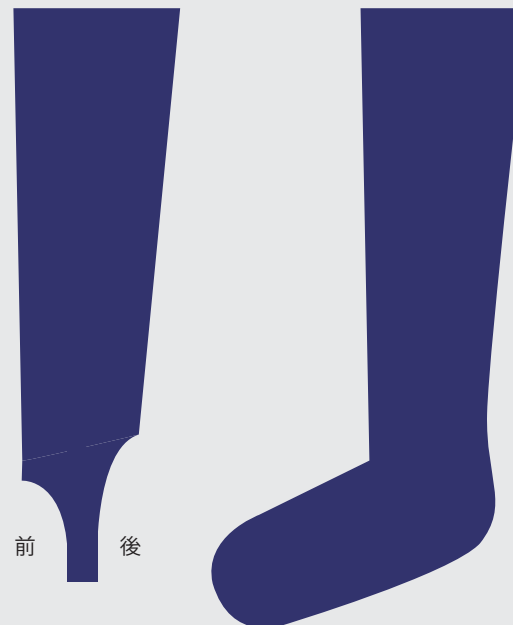
ストッキング (ネイビー) アンダーソックス (ネイビー)

ストッキングとアンダーソックスを2枚重ねてはきます。 ストッキングは山の低い方が前、高い方を後ろにはきます。